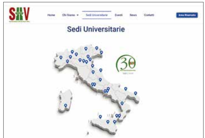
3. Le sedi universitarie affiliate alla SIIV rappresentate sul nuovo sito

sta anche operando per un completo aggiornamento e re-styling del proprio sito web istituzionale.