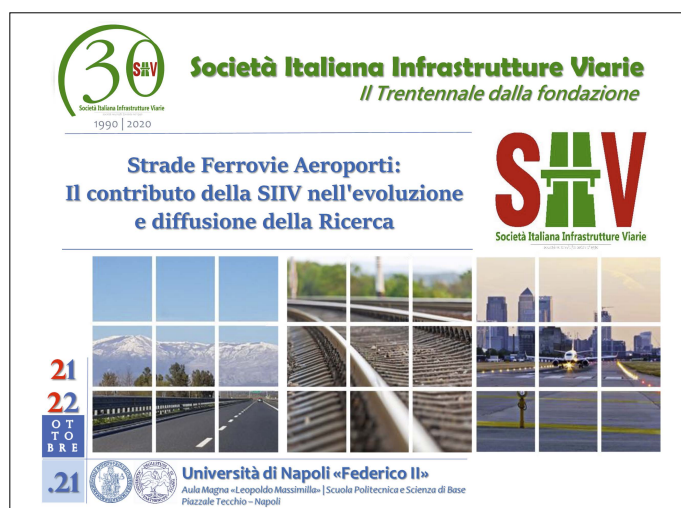
1. Il banner informativo dell'evento per il trentennale SIIV

interruzione a causa dell'emergenza sanitaria - possano riprendere quanto prima già a partire dall'anno in corso o nei primi mesi del 2022.